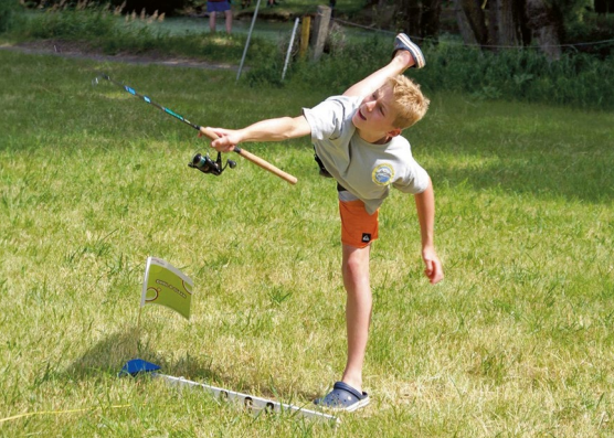
L'avenir de la pêche : des jeunes enthousiastes.